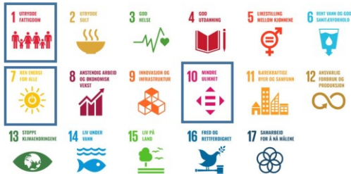
Globale mål som overlapper med andre mål