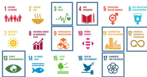
Rådmannens forslag til fokusområder for Kongsvinger